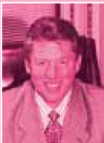
John C. Maxwell